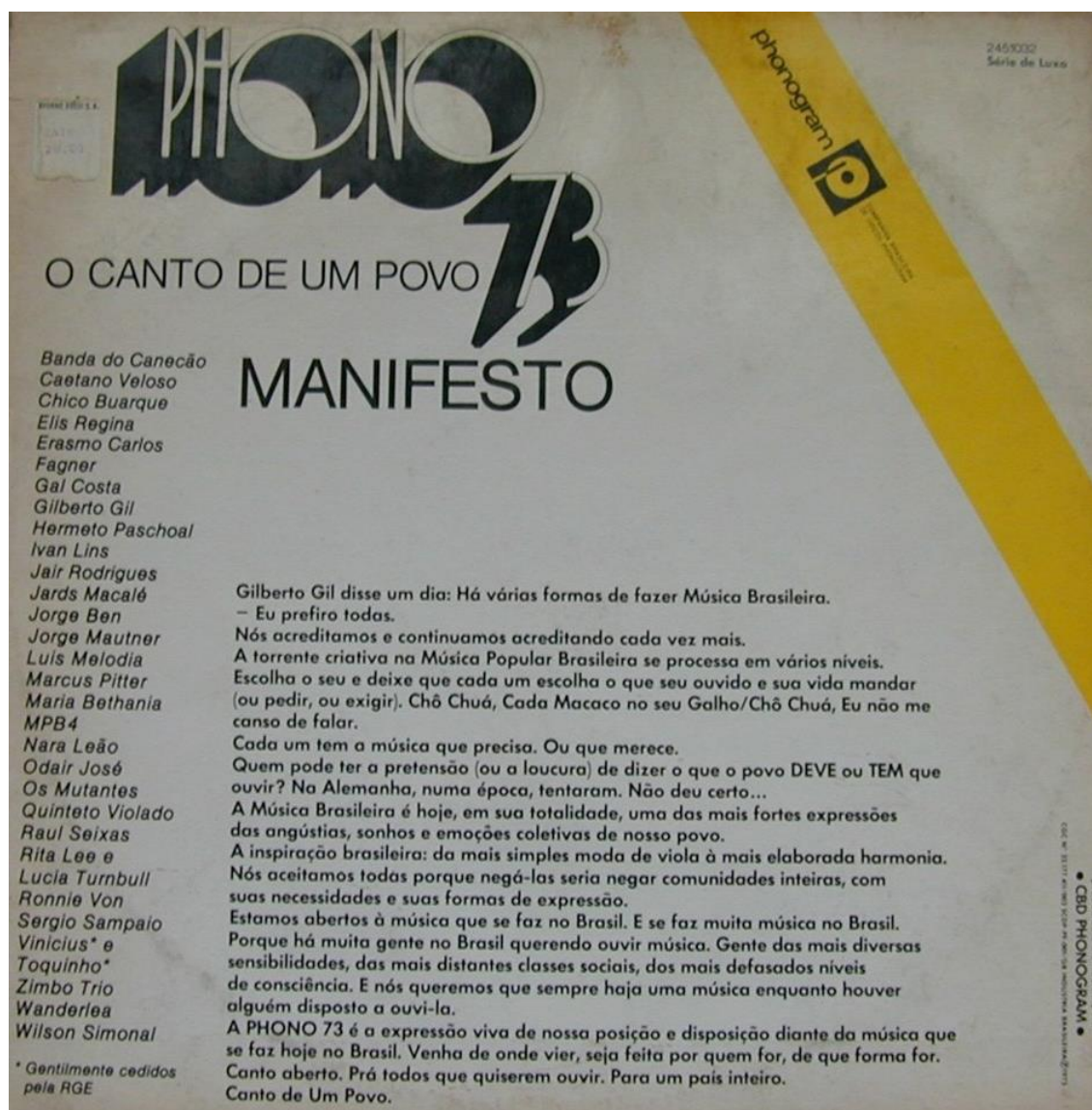
Ex.2 – Contracapa do LP Phono 73: o canto de um povo .

A retórica buscava conjugar política e estética desde o título, mas escancarava essa busca quando aludia à Alemanha durante o governo nazista – modo pouco sutil de qualificar o autoritarismo da Censura – ou quando mencionava a existência, no Brasil, de classes sociais as “mais distantes”. Desse ângulo, o “Manifesto” ainda reverberava aquela “relativa hegemonia cultural da esquerda no país”, dando continuidade, à sua maneira, ao grande negócio em que se transformara a “produção de esquerda” a partir de 1950 (SCHWARZ, 1978, p. 62-67). 18 Abrindo o