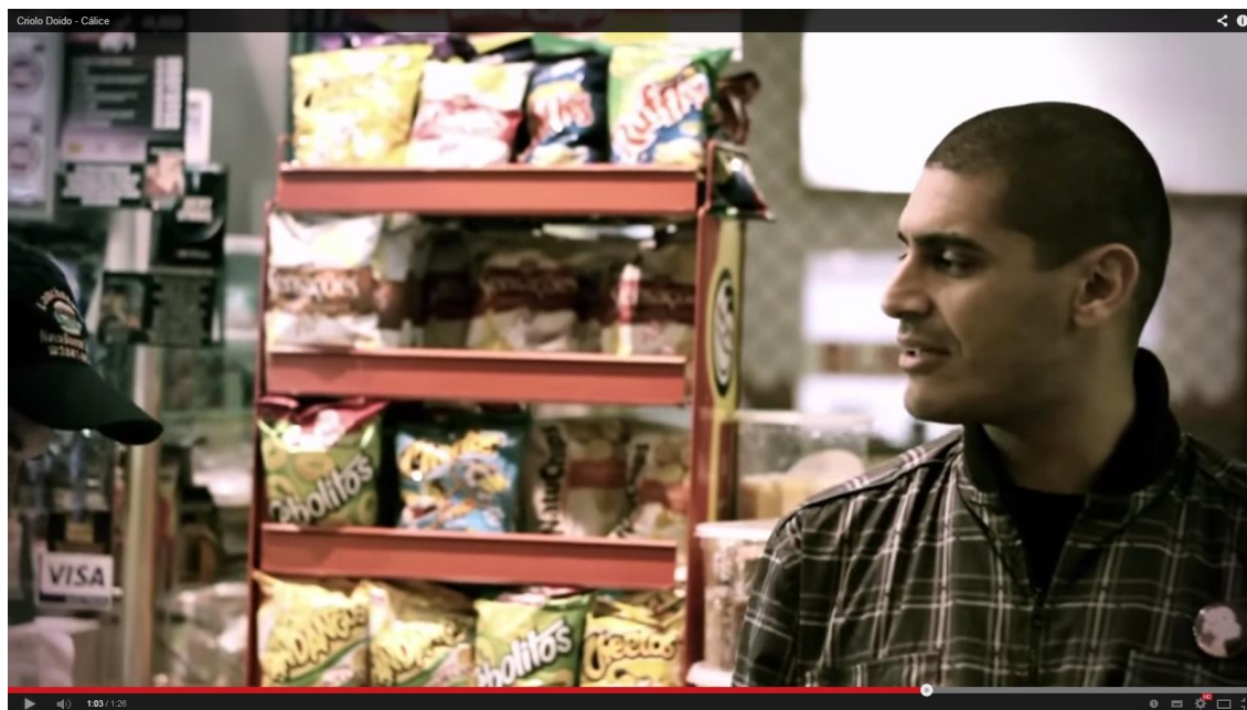
Ex.5 – Criolo Doido – Cálice, 1:03.

vê-se a aba do boné muito rapidamente, de tal modo que adivinhar a palavra “Lanchonete”, acima do que parece ser o desenho de um x-salada, é tarefa para quem pausa o vídeo em 1:03 e afia os olhos.