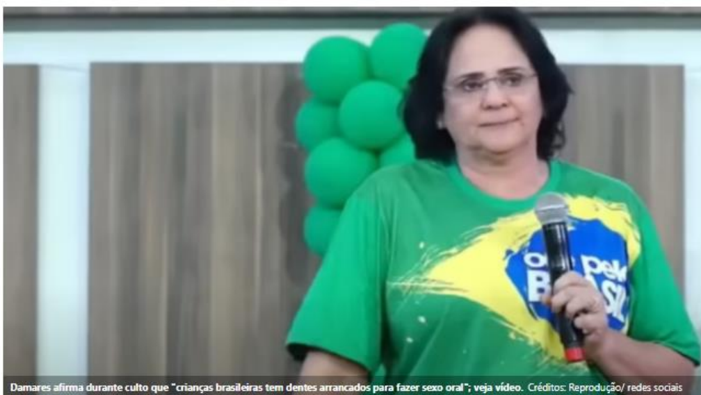
Damares afirma durante culto que "crianças brasileiras tem dentes arrancados para fazer sexo oral"; veja vídeo.

As declarações escabrosas da ex-Ministra da Família também falam sobre o uso de bebês para o comércio de vídeos pornográficos